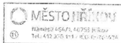
Bc. Jiří Semerád vedoucí odboru vnitřní správy